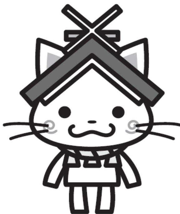
島根県観光キャラクター「しまねっこ」 島観連許諾第8161号

会 場 松江総合運動公園テニスコート 日 程 2024年10月26日(土)~10月27日(日) 主 催 島根県テニス協会 後 援 (公財)島根県スポーツ協会 主 管 島根県テニス協会 ジュニア委員会 島根県テニス協会 審判委員会